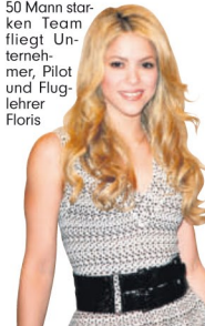
Auch Sängerin Shakira flog schon mit Air Hamburg